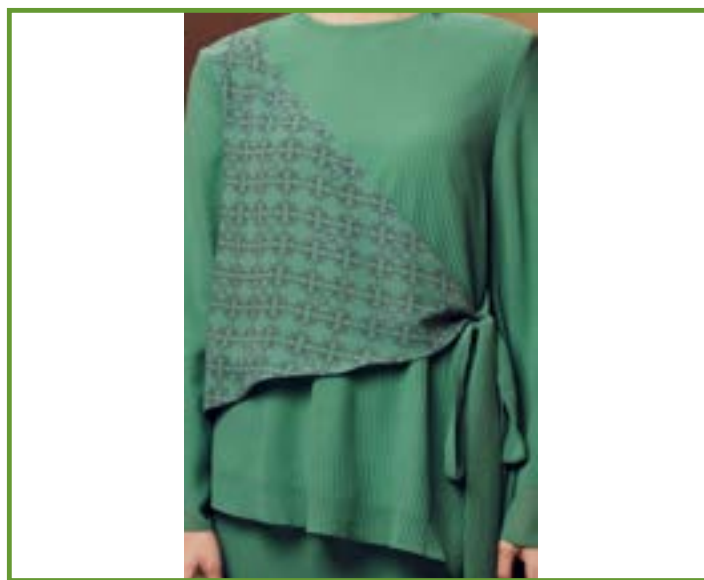
Figura 4.

Hay diferencia de telas en este atuendo. La falda y las mangas están hechas de la misma tela, pero, a diferencia de la falda, existe un plisado ligero en la camiseta que es transparente, pero al llevar otra capa de tela debajo el atuendo no logra mostrar nada de piel.