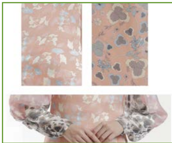
Figura 6.

La prenda fue confeccionada con una mezcla de nylon y chifon, lo cual hace que tenga esa textura brillante y un porcentaje bajo de transparencia en el atuendo. Como se muestra en la imagen superior, la tela es de un color rosado, a excepción de las mangas que son un tono más claro en el brazo y en los puños son de un tono más apagado, creando un énfasis visual en esa parte de la manga.