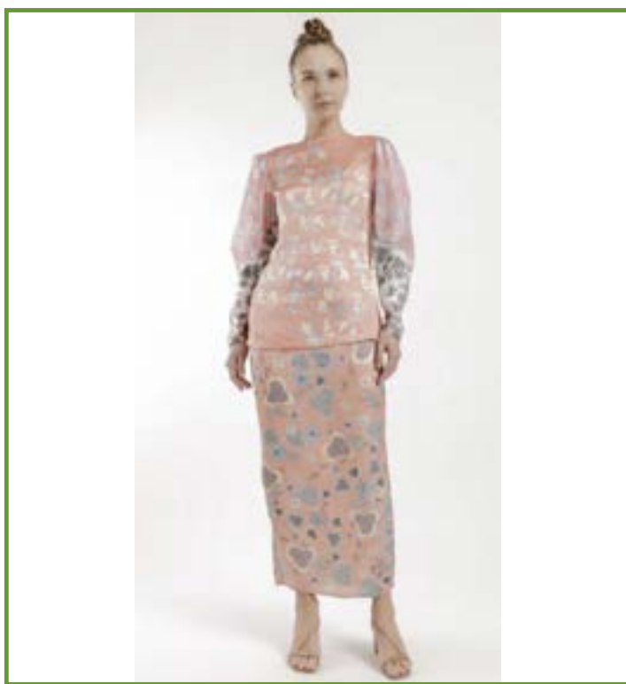
Figura 5.

La camiseta tiene un cuello barco y mangas abullonadas con puños delgados y la falda es de estilo recto casi lápiz. La silueta de la pieza es pegada, se puede observar completamente la figura de la modelo, sin embargo, nunca se pierde la esencia de la modestia en la prenda ni la formalidad de la misma. Las mangas logran crear buena proporción de