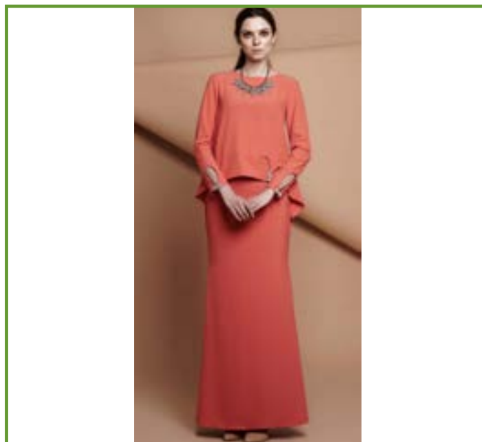
Figura 2.