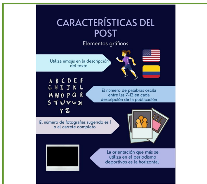
Figura 4. Características del post