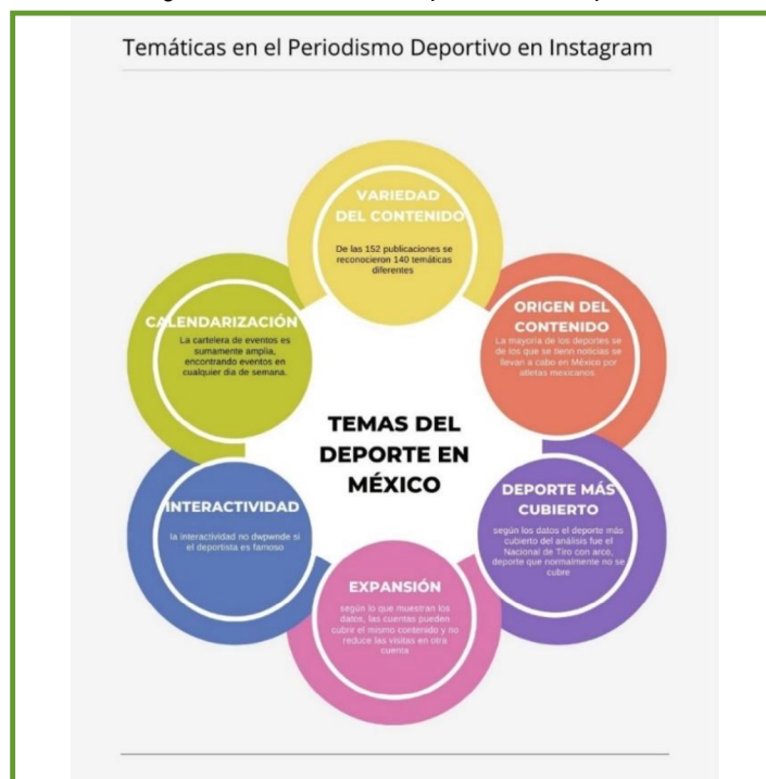
Imagen 1. Temáticas en el periodismo deportivo

Las categorías de temas de los que se hablan más frecuentemente son: motivación en el deporte y la información relevante del evento. En general, explican los datos en la Imagen 1.